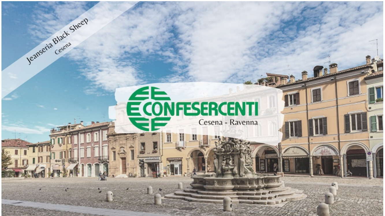
4° episodio Imprese Confesercenti Ravenna e Cesena: Jeanseria BlackSheep, Cesena.