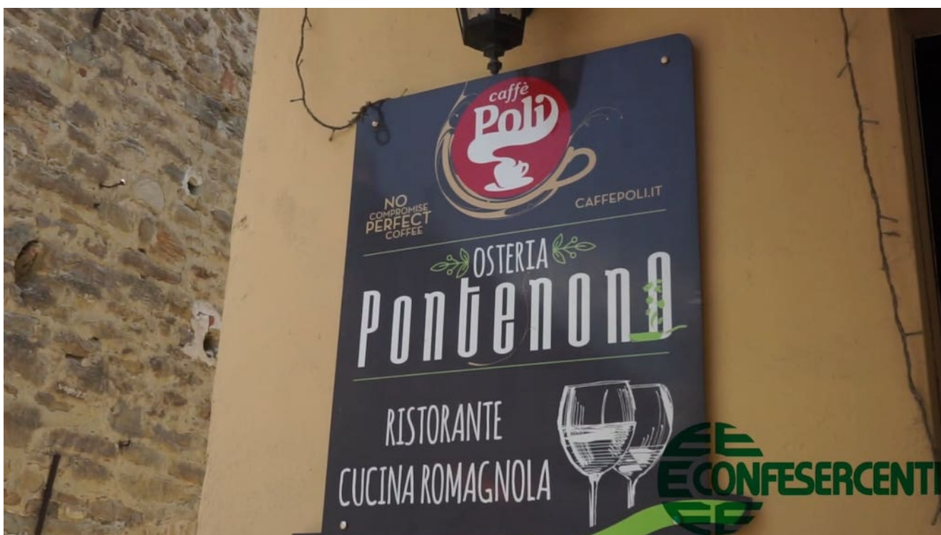
27° episodio Imprese Confesercenti Ravenna e Cesena: Osteria Pontenono a Fognano di Brisighella