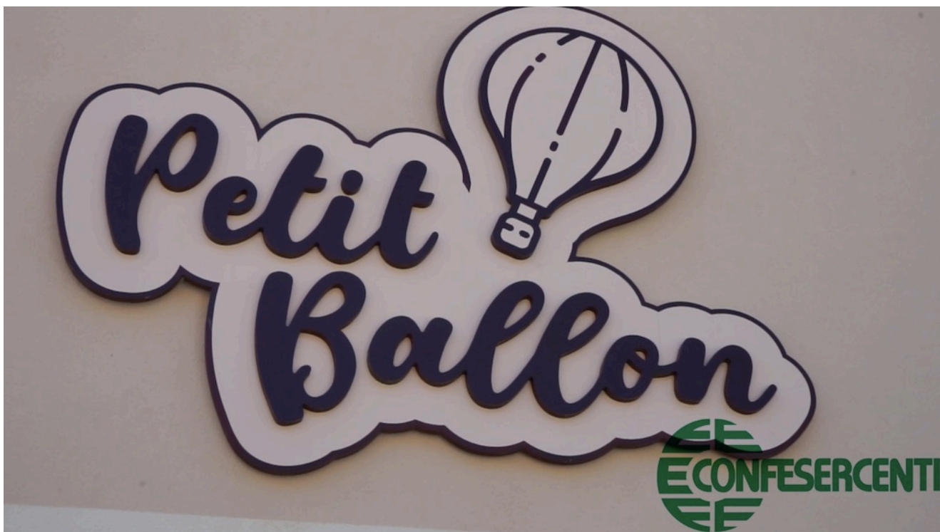
36° episodio Imprese Confesercenti Ravenna e Cesena: Petit Baloon, Gambettola.