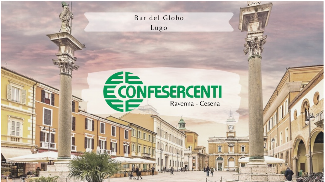
18° episodio Imprese Confesercenti Ravenna e Cesena: Bar del Globo, Lugo