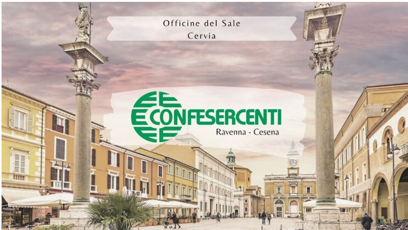
10° episodio Imprese Confesercenti Ravenna e Cesena: Officine del Sale, Cervia.