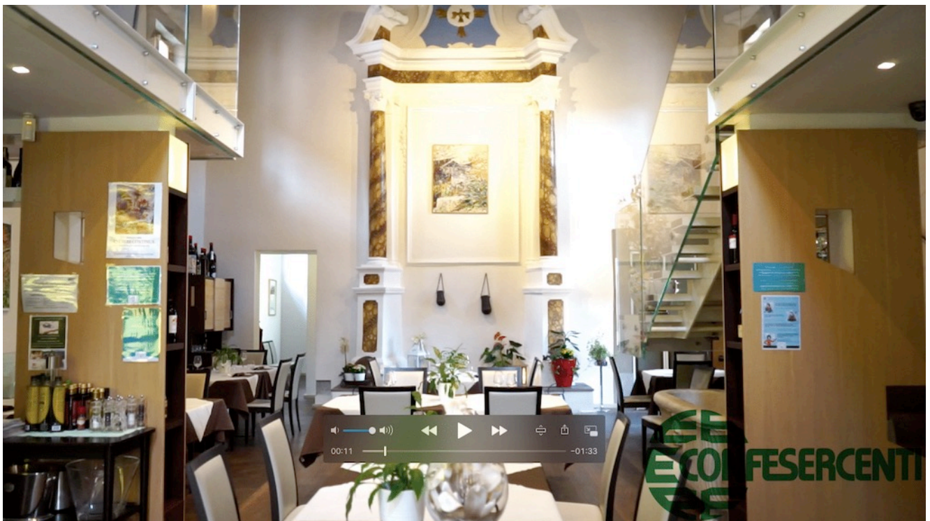
29° episodio Imprese Confesercenti Ravenna e Cesena: Ristorante Cenacolo Santa Lucia, Bagno di Romagna