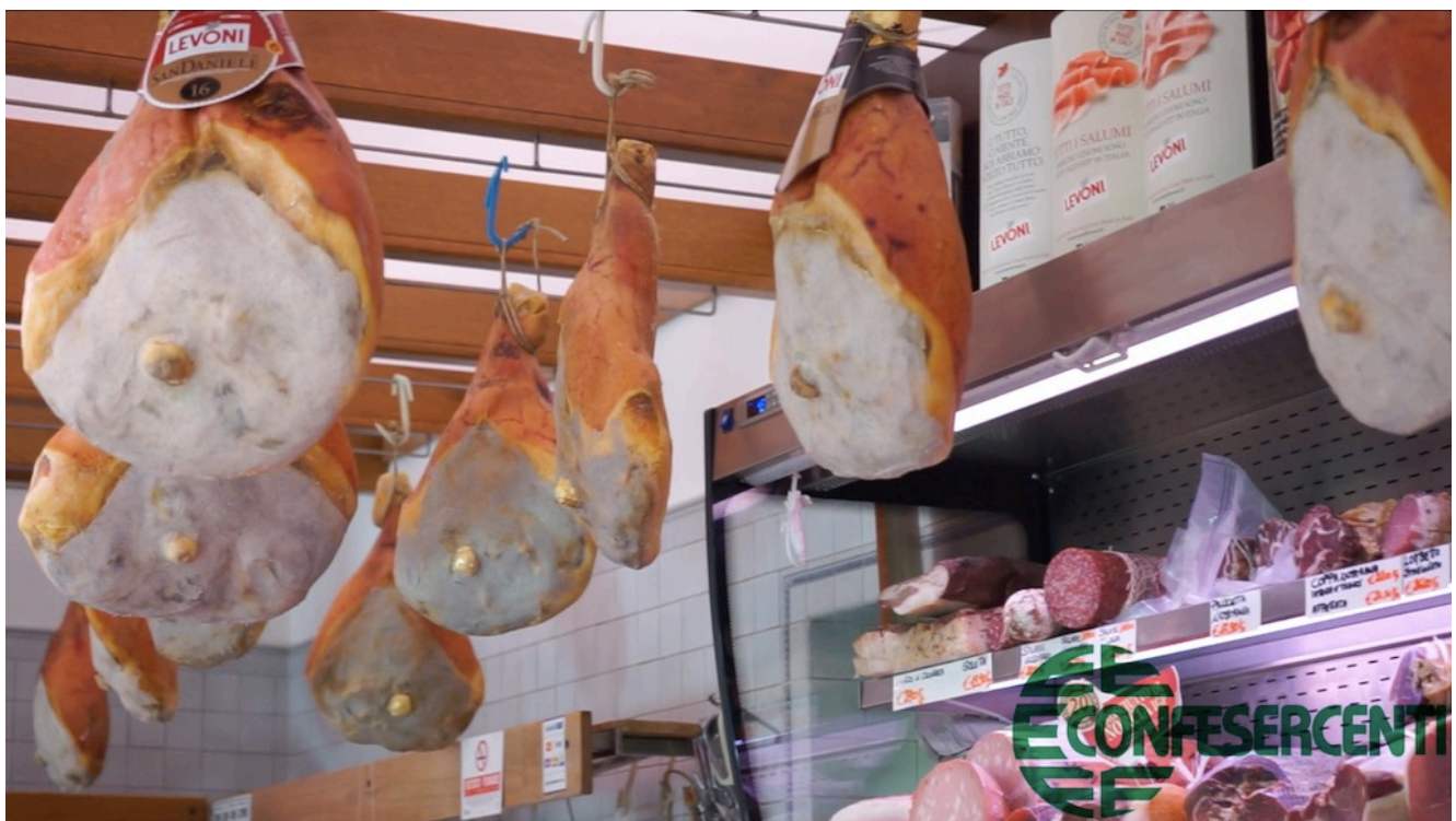
37° episodio Imprese Confesercenti Ravenna e Cesena: Macelleria F.lli Campedelli, Savignano sul Rubicone.