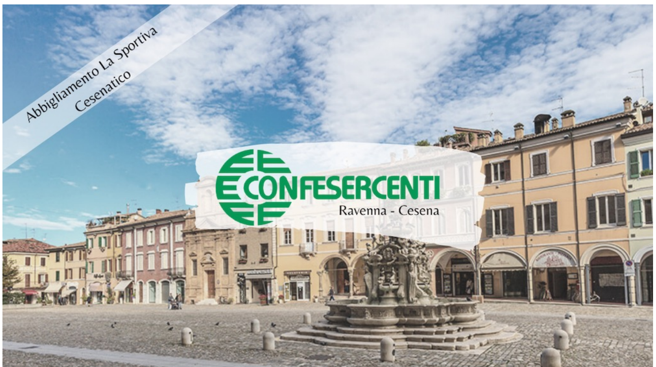
19° episodio Imprese Confesercenti Ravenna e Cesena: Abbigliamento La Sportiva, Cesenatico