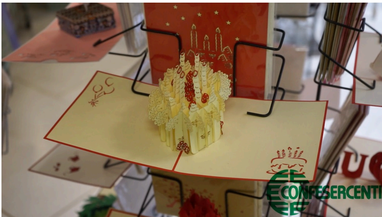
35° episodio Imprese Confesercenti Ravenna e Cesena: NonSoloCarta, Ravenna.