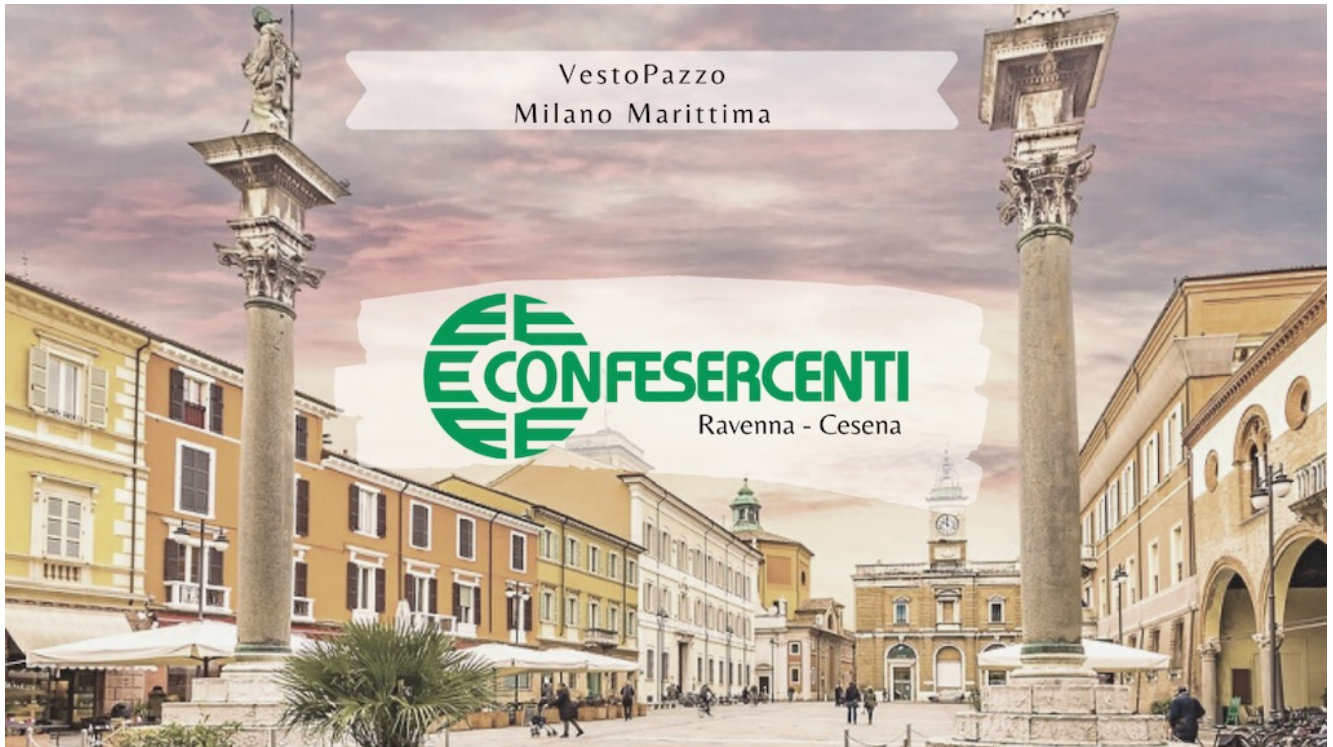
20° episodio Imprese Confesercenti Ravenna e Cesena: Vestropazzo, Milano Marittima