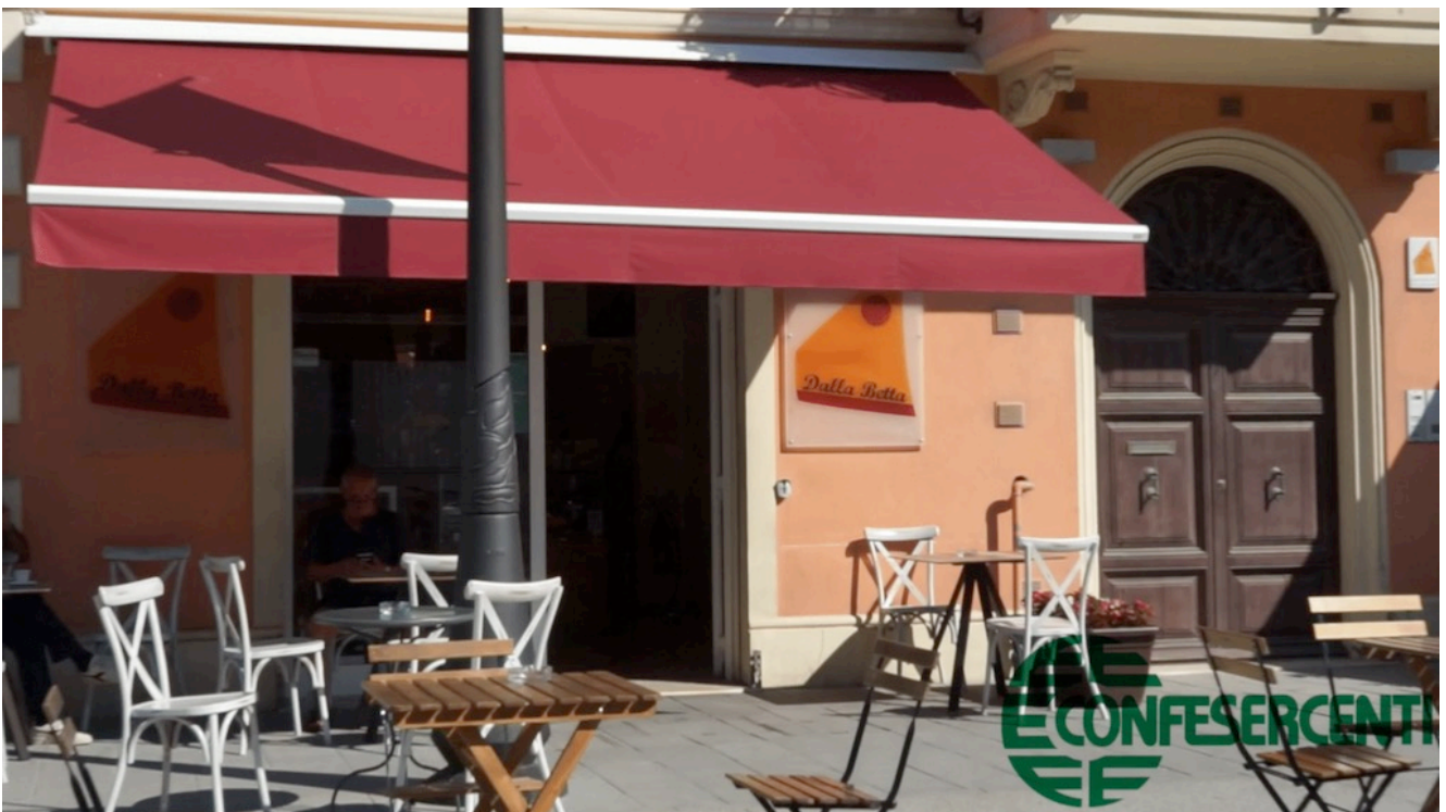
39° episodio Imprese Confesercenti Ravenna e Cesena: Bar dalla Betta, Cervia.