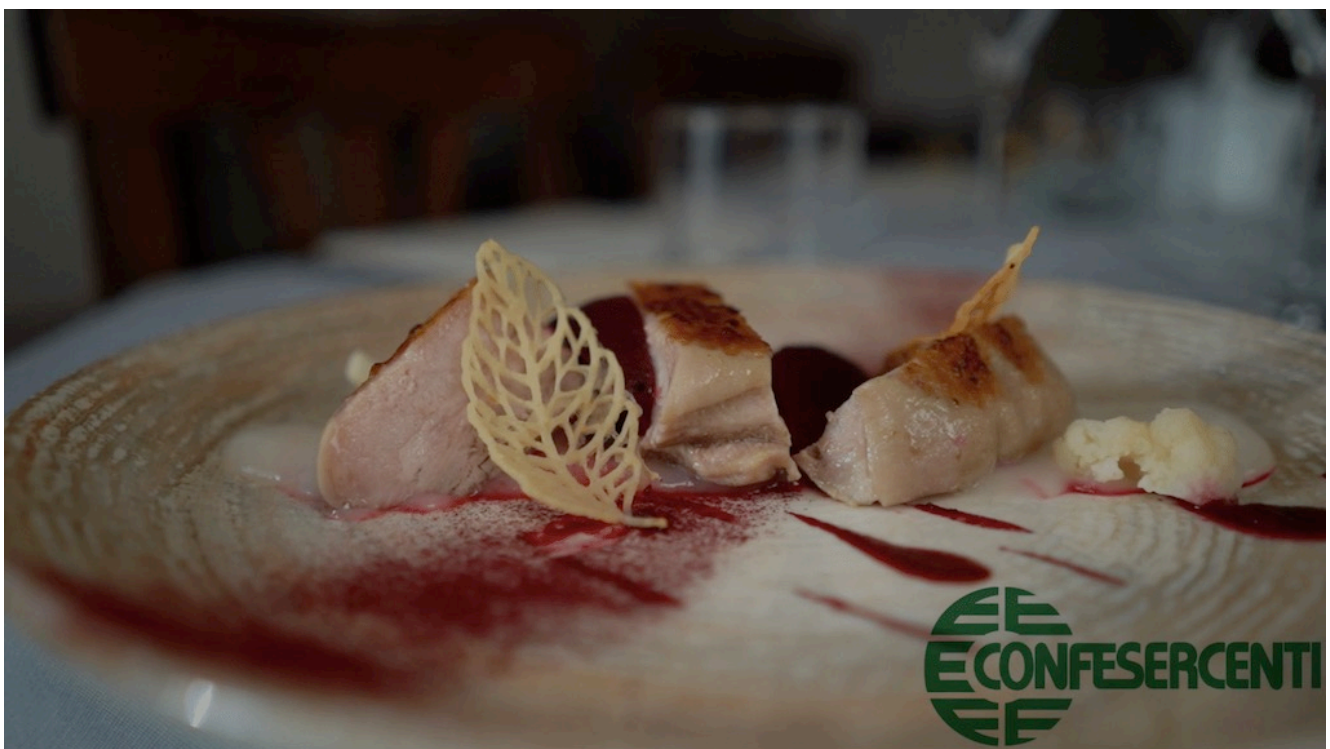
43° episodio Imprese Confesercenti Ravenna e Cesena: Osteria Malabocca, Bagnacavallo.