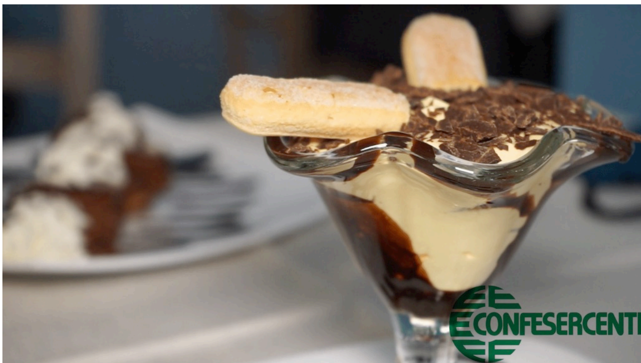
46° episodio Imprese Confesercenti Ravenna e Cesena: Ristorante Sesto Senso, Savignano.