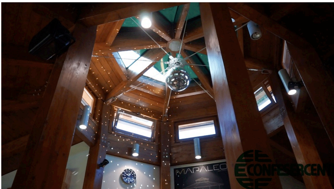
45° episodio Imprese Confesercenti Ravenna e Cesena: Bar Mapaleo, Savignano.