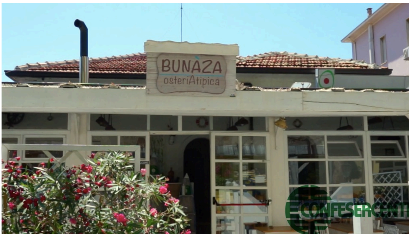
32° episodio Imprese Confesercenti Ravenna e Cesena: La Bunàza, OsteriAtipica di Bellaria-Igea Marina.