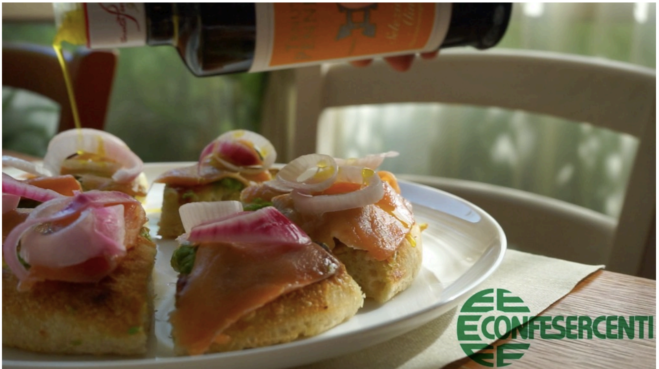
33° episodio Imprese Confesercenti Ravenna e Cesena: Pizzeria Da Mario, Riolo Terme.