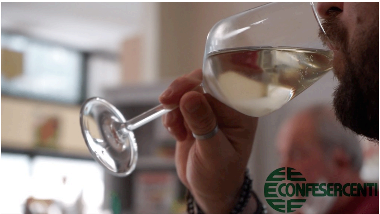
44° episodio Imprese Confesercenti Ravenna e Cesena: Bar Bosco Verde, Gambettola.