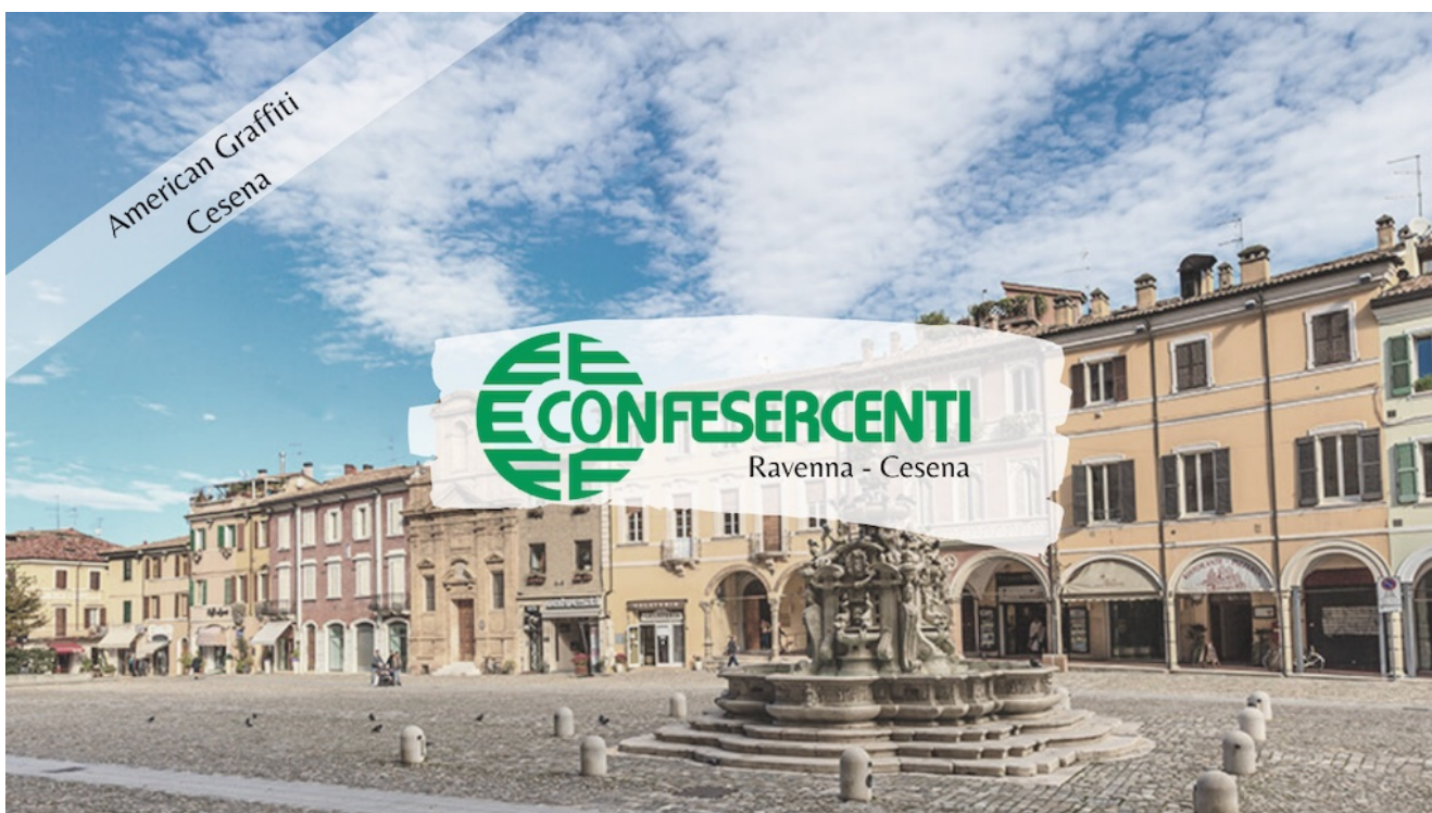
21° episodio Imprese Confesercenti Ravenna e Cesena: America Graffiti, Cesena