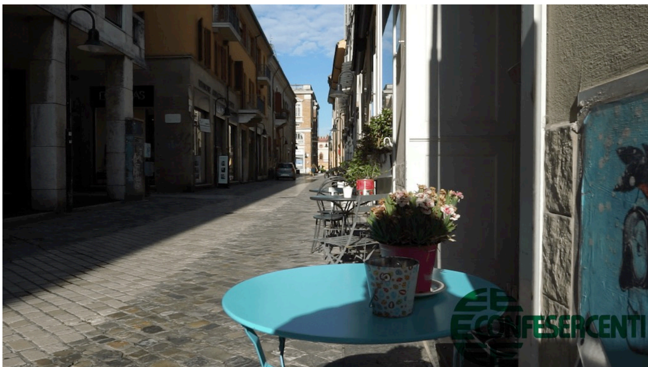
28° episodio Imprese Confesercenti Ravenna e Cesena: Caffè Letterario, centro storico Ravenna