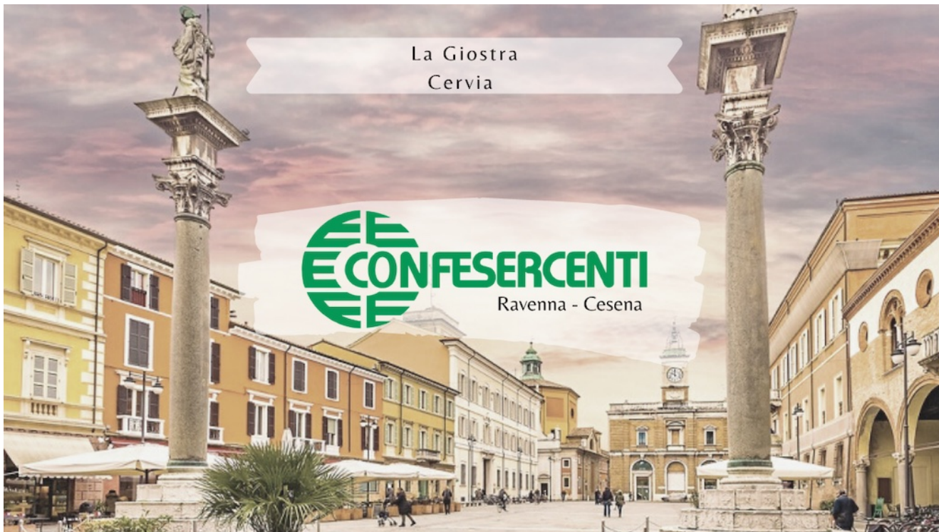
22° episodio Imprese Confesercenti Ravenna e Cesena: Giostra, Cervia