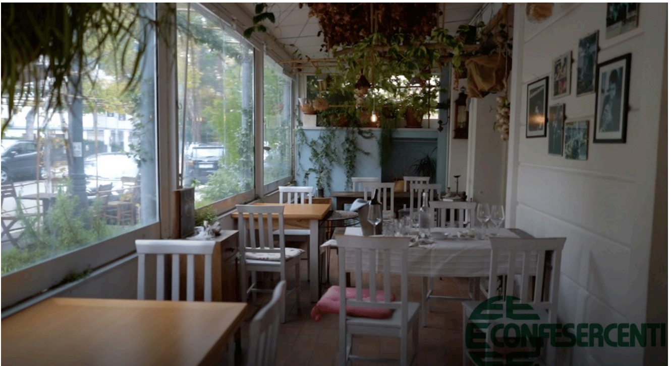
42° episodio Imprese Confesercenti Ravenna e Cesena: La SaLuMa, Cesenatico.