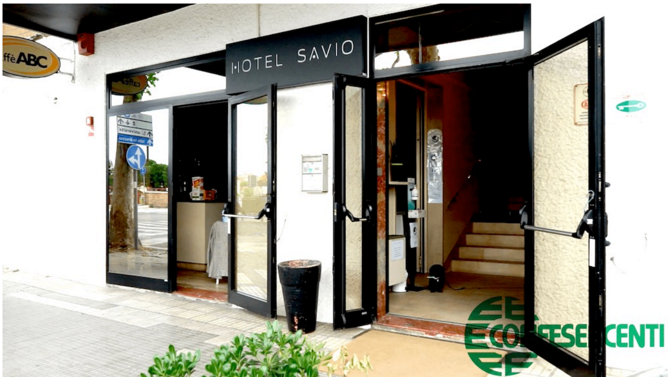
48° episodio Imprese Confesercenti Ravenna e Cesena: Hotel Savio, Cesenatico.