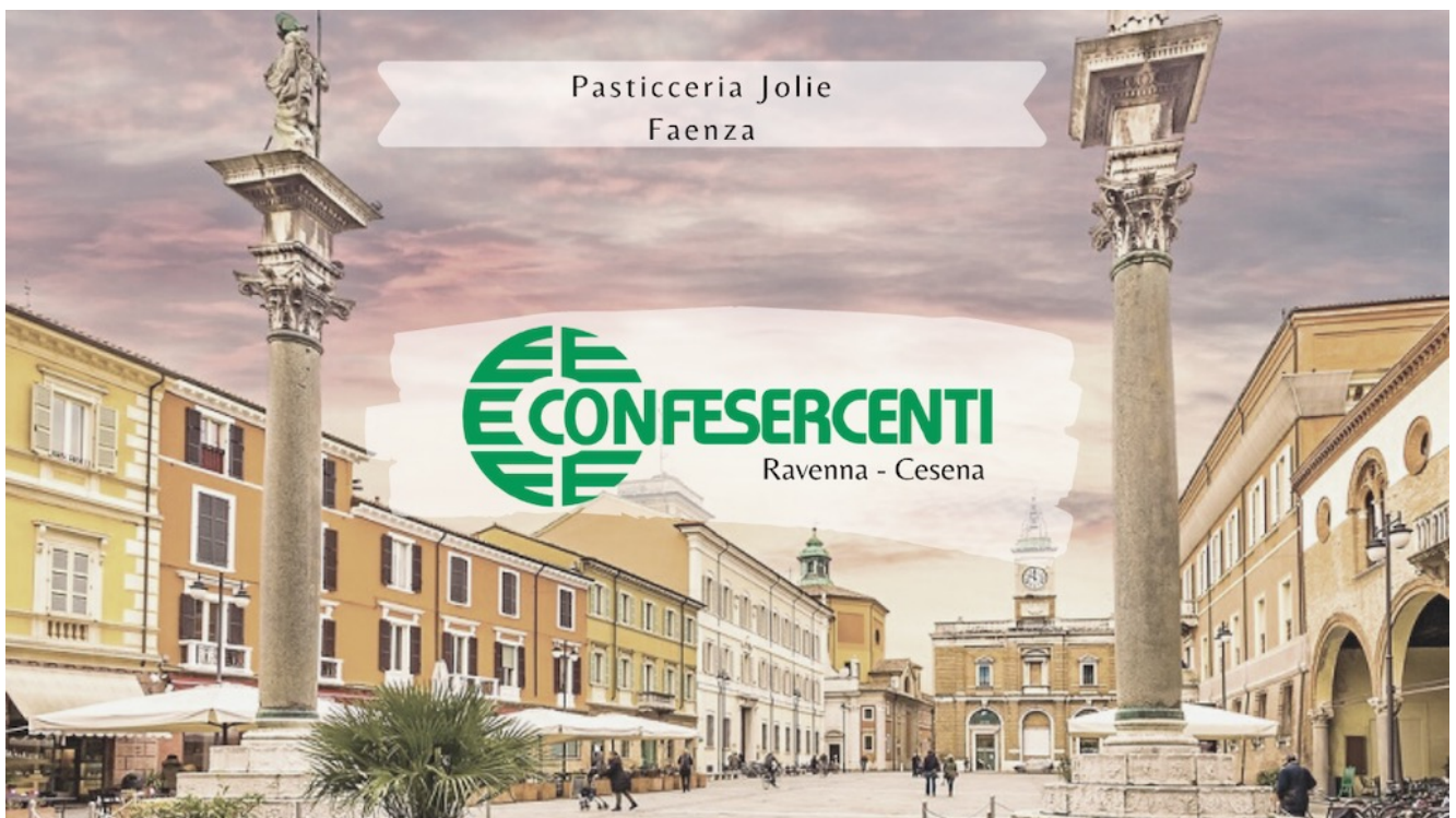
3° episodio Imprese Confesercenti Ravenna e Cesena: Pasticceria Jolie, Faenza.