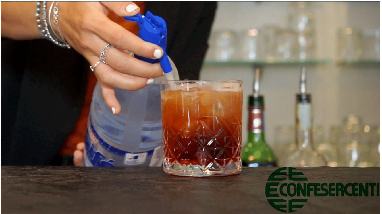
40° episodio Imprese Confesercenti Ravenna e Cesena: Bar Il Caffeina, Cesena.