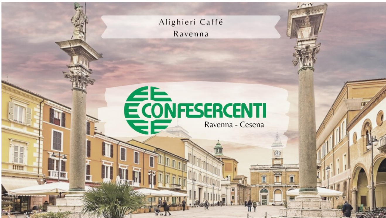
12° episodio Imprese Confesercenti Ravenna e Cesena: Alighieri Caffè, centro storico Ravenna.