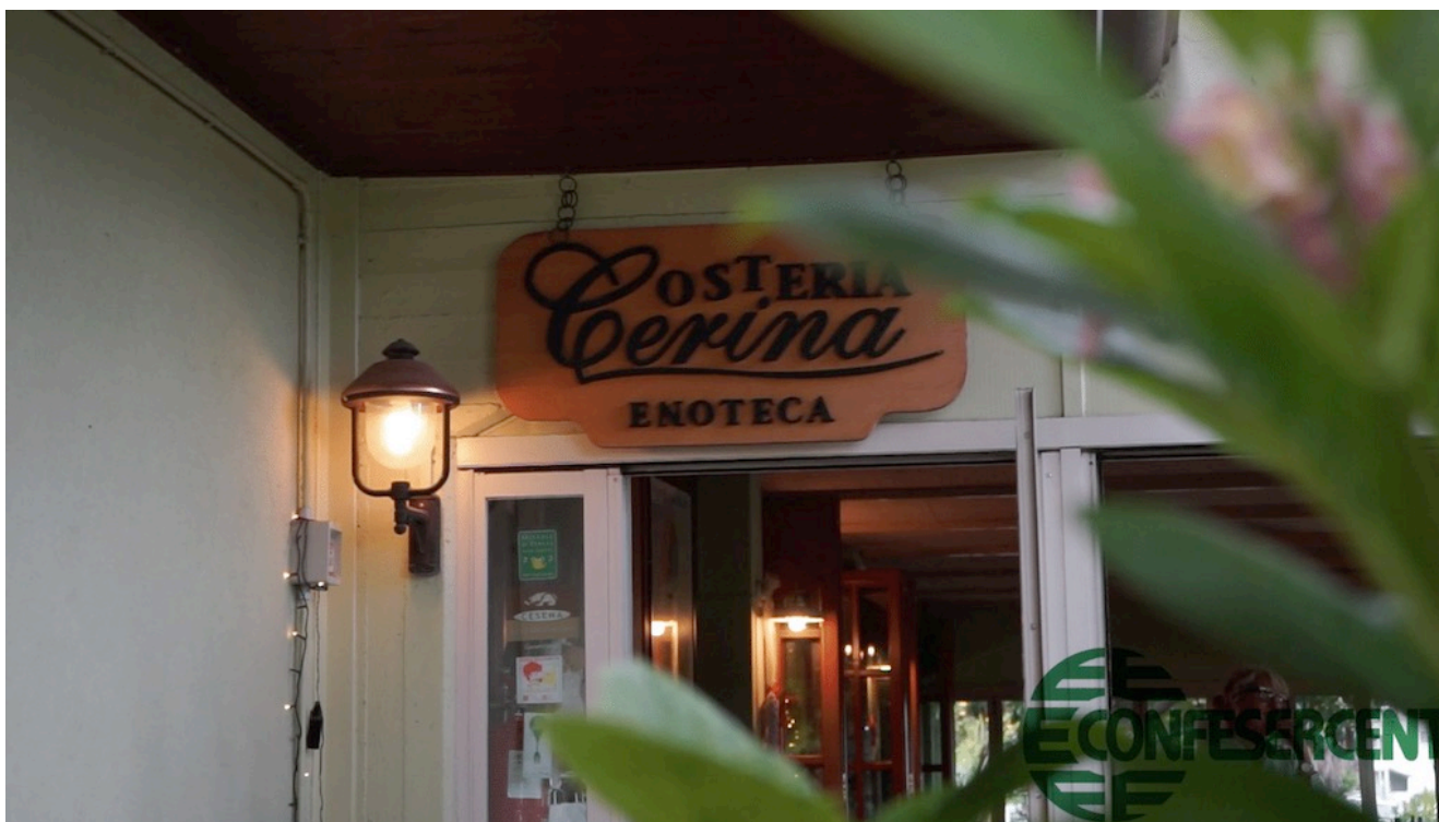
26° episodio Imprese Confesercenti Ravenna e Cesena: Ristorante La Cerina di San Vittore, Cesena.