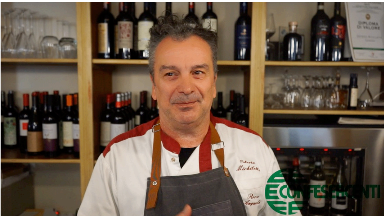
41° episodio Imprese Confesercenti Ravenna e Cesena: Osteria Michiletta, Cesena.