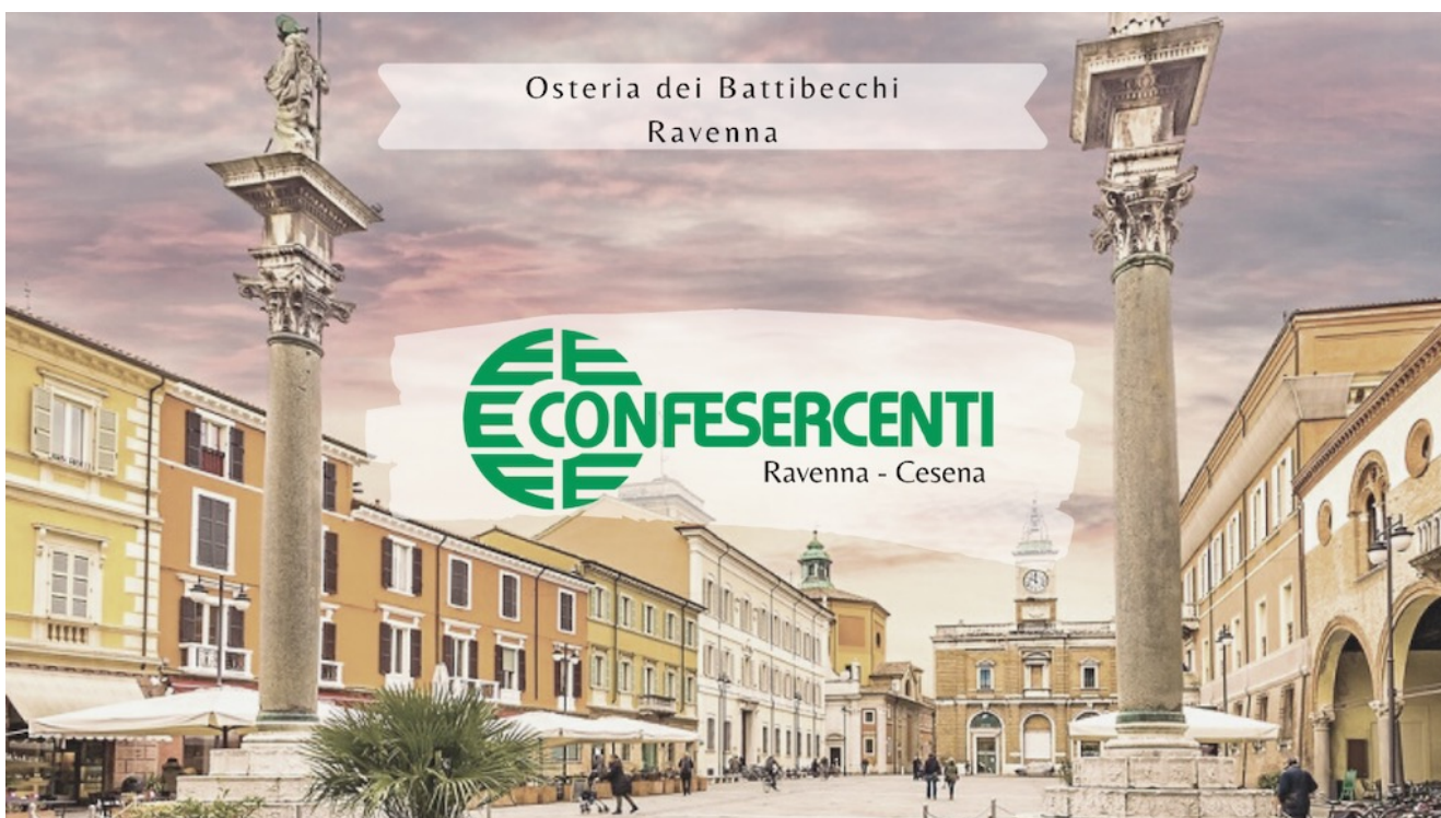
9° episodio Imprese Confesercenti Ravenna e Cesena: Osteria dei Battibecchi, Ravenna.