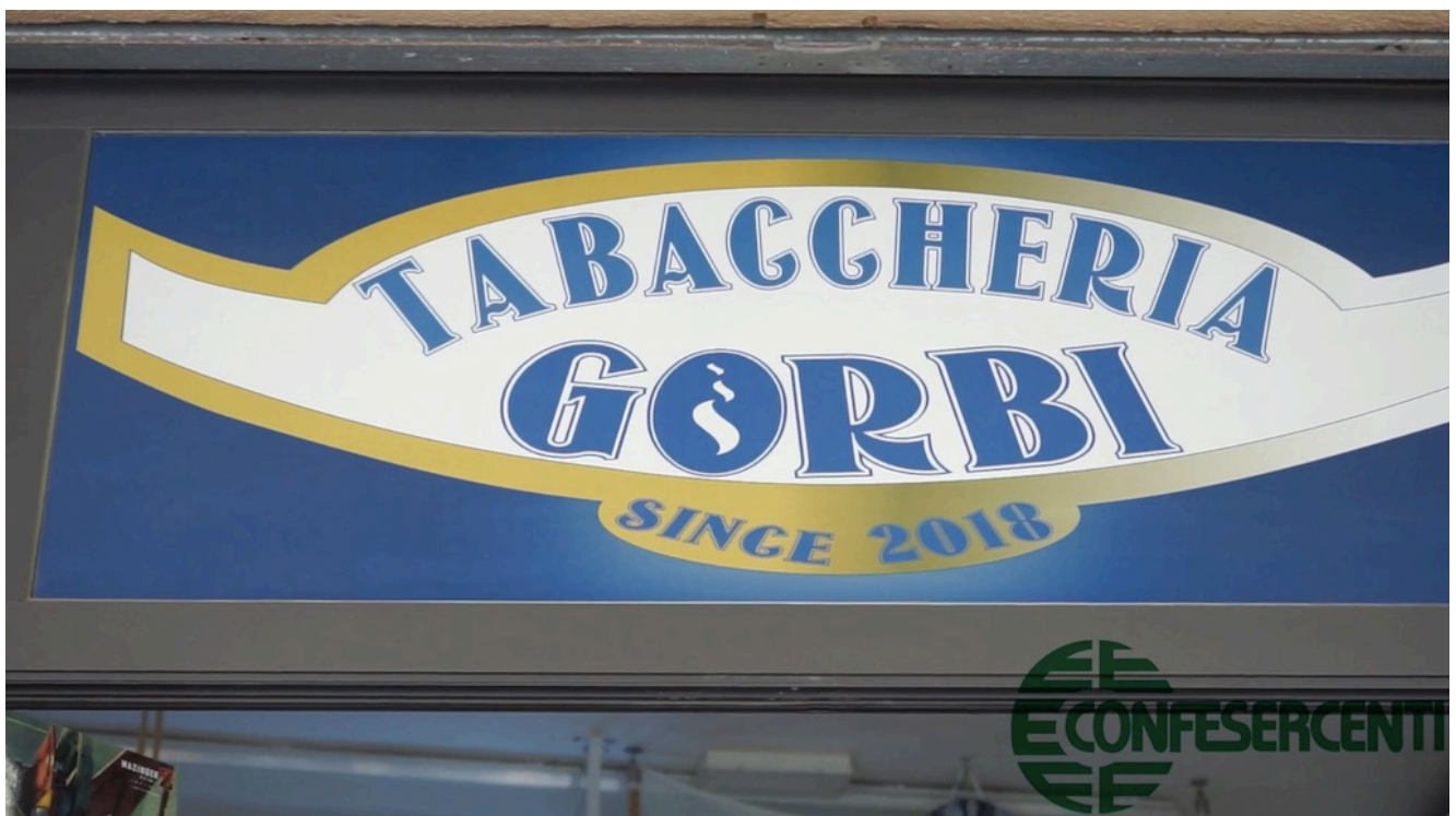
47° episodio Imprese Confesercenti Ravenna e Cesena: Bar Gorbi, Cesenatico.