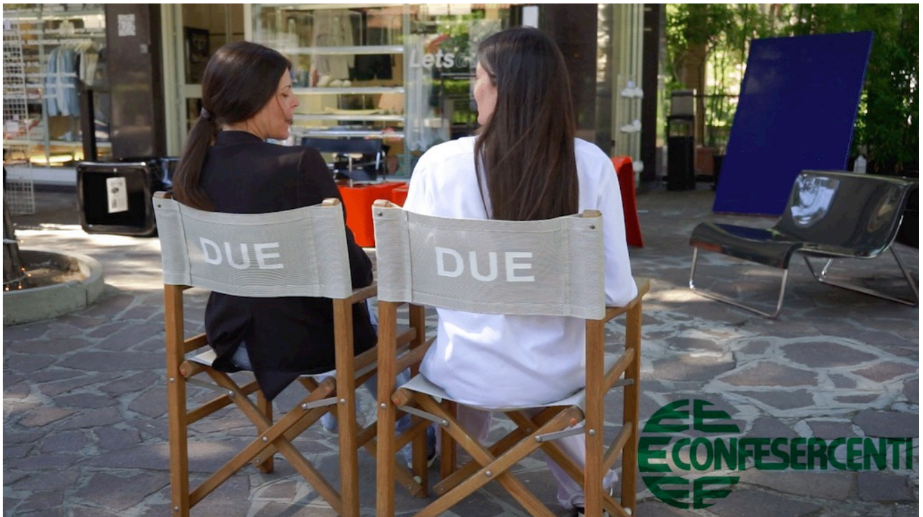
30° episodio Imprese Confesercenti Ravenna e Cesena: Negozio abbigliamento DUE di Milano Marittima.