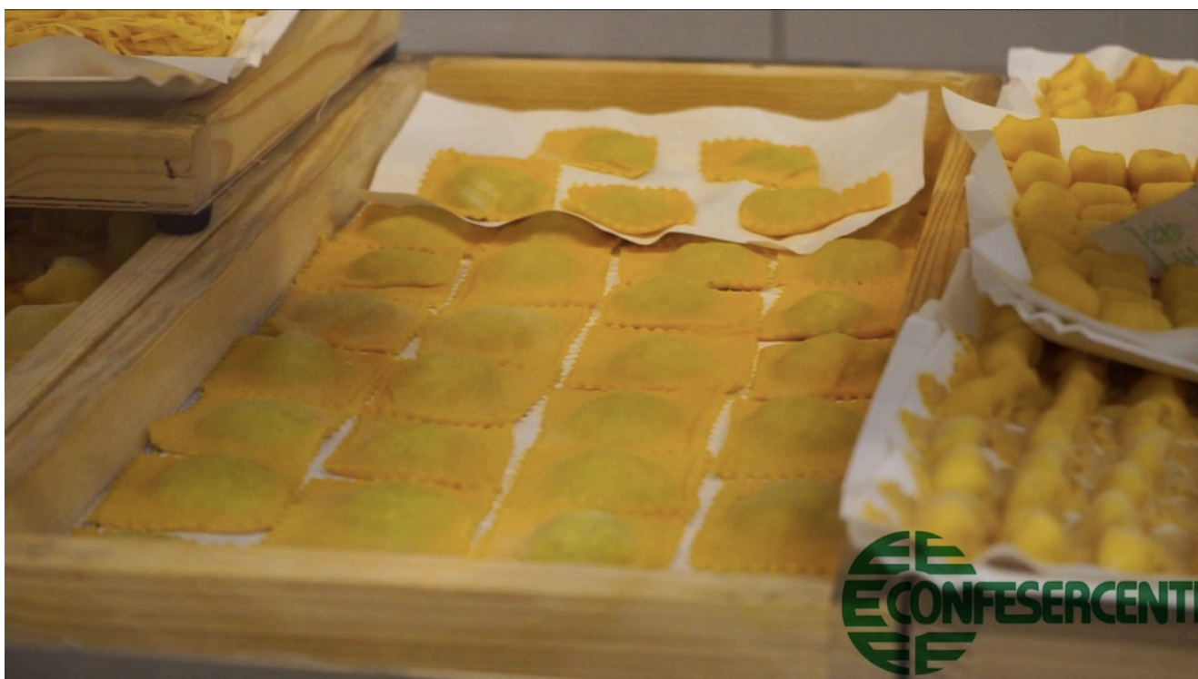
31° episodio Imprese Confesercenti Ravenna e Cesena: Pastificio Brodino, centro storico di Cesena.