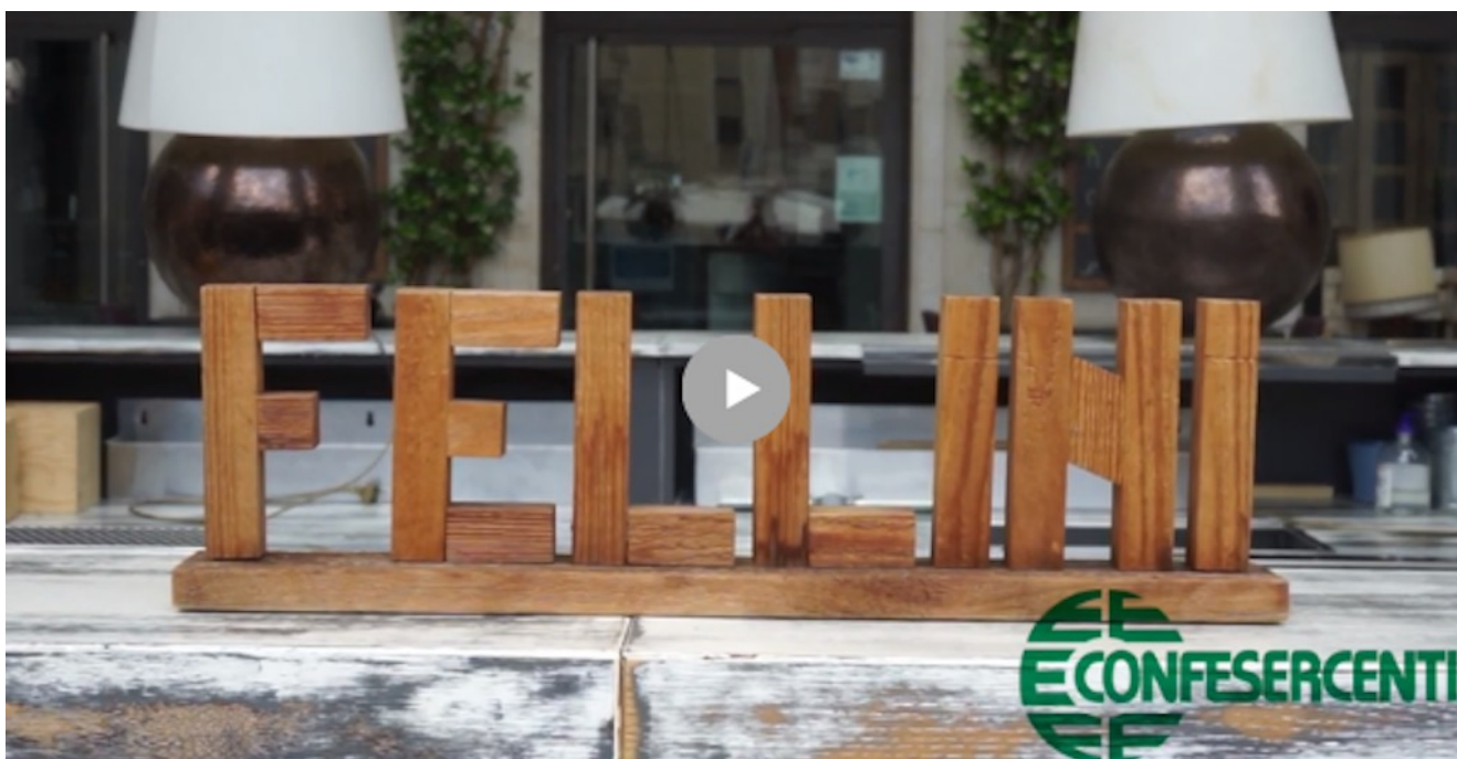
25° episodio Imprese Confesercenti Ravenna e Cesena: Fellini ScalinoCinque, Ravenna